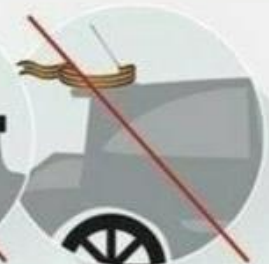
на кузове автомобиля

Помните, ленточка – это не просто кусок ткани. Это символ Победы над фашизмом!